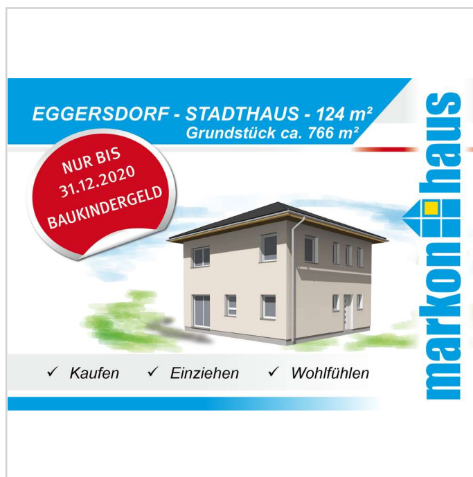
Eggersdorf - Bötzeestraße Hau